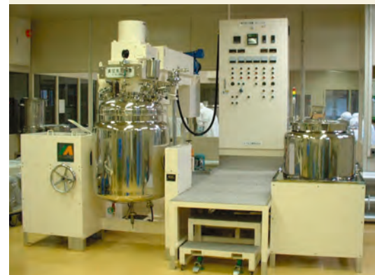
機械名：みづほ式真空乳化装置250型（VQ-1-250型） 機械メーカー：みづほ工業株式会社 標準仕込量：100kg～200kg 攪拌方式：ダブル攪拌型 （高粘度ホモミキサー：300～3500rpm無段変速、 撈取ミキサー：10～100rpm無段変速） 接液部材質：SUS304製 350番パフ研磨仕上げ ※水槽：開放式原料溶解槽 160ℓ 下部バルセーター攪拌装置付 油槽：開放式原料溶解槽 100ℓ 下部バルセーター攪拌装置付

当社では、最新式サニタリー250kgタンクで、100kgの小ロットから生産対応致します。また、高速3500回転可能な高粘度ホモミキサー付ですので、キメ細かな使用感の高いクリーム剤がつけれます。