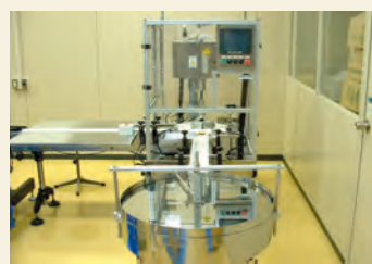
機械名：自動クリームジャー充填機（シバタMSGP-1型） 機械メーカー：株式会社シバタエンジニアリング 充填量：20g～300g対応 標準能力：20～40ヶ/分（容器形状およびバルク性状による） 充填方式：シリンダー・ピストン方式 通液部：SUS304製および特殊樹脂製 ※基本的に、充填部とキャップ部の専用部品が、容器の形状毎に必要になります。