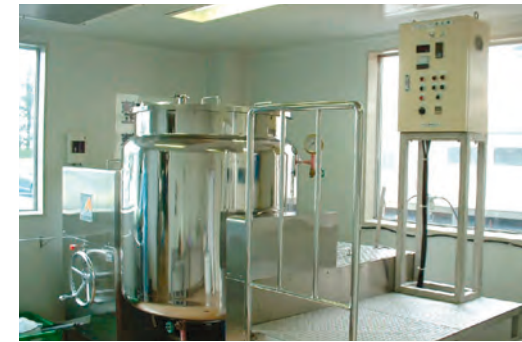
機械名：みづほ式シロップ攪拌槽（OSL-800型） 機械メーカー：みづほ工業株式会社 標準仕込量：600ℓ（200ℓ～400ℓも対応可能） 攪拌方式：下部シールレスミキサー攪拌型 （タービン型インペラー50～300rpm無段変速） 接液部材質：SUS304製 350番パフ研磨仕上げ

当社では、最新式サニタリー内用液剤攪拌槽で、200ℓの小ロットから生産対応いたします。また、攪拌方式はシールレスミキサー方式ですので、攪拌槽内で磁気を利用した独立タービン型インペラーが50～300無段変速回転で、衛生的に効率良く攪拌いたします。